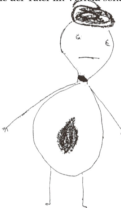
Abb. 5-1 Körpergefühl eines Opfers

Fasst man die Situation von kindlichen und jugendlichen Opfern zusammen, so ist mit aller Deutlichkeit darauf hinzuweisen, dass jedes Kind sexuellen Übergriffen ausgesetzt sein kann. Und dass niemand, sei er noch so seriös und angesehen, von vornherein als Täter auszuschließen ist. Die Übergriffe sind fast immer geplant, selten einmalig und sie unterliegen dem Geheimhaltungsdruk. Die Strategien der Annäherung und Verführung richten sich, grob eingeteilt, nach dem jeweiligen Lebensalter des Kindes, umfassen aber immer auch ganz persönlich abgestimmte Lockmethoden, die der Täter im Vorfeld sondiert hat, sowie den Aspekt, dem Kind einen Wunsch zu